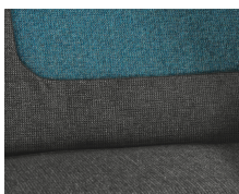
+ Klädsel Salerno inkl. förar- och passagerarstolsöverdrag