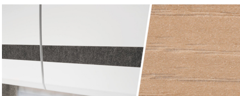
+ Trädekor Noce Nagano