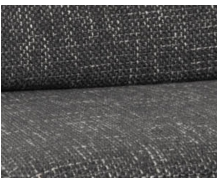
+ Klädsel City Vibes