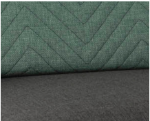
+ Klädsel Downtown