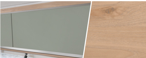
+ Trädekor Noce Nagano