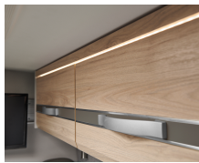
+ Trädekor Noce Nagano, kontrastdekor Web Pebble Grey