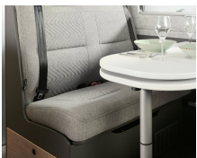
+ Klädsel Scandi