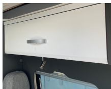
+ Trädekor Amberes Oak, kontrastdekor Trace Dark Grey