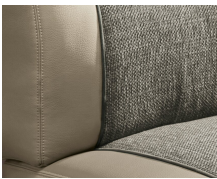
+ Klädsel Camino