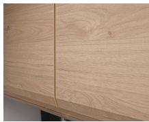
+ Trädekor Noce Nagano