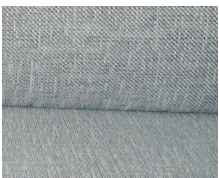
+ Klädsel Drake