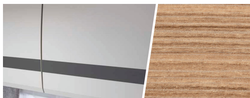
+ Trädekor Rosario Cherry